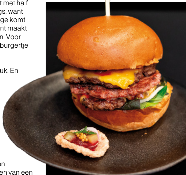
De winnende burger

Want zelf kom je daar als ondernemer niet altijd aan toe, vertelt Waninge. "Als ondernemer ben je altijd bezig." En daar geniet hij ook van, van dat bezig zijn. Nieuwe burgers bedenken, de medewerkers, de gasten. "Zo'n wedstrijd is leuk, maar het allerleukste zijn de blijge gezichten in de zaak. Daar doe je het voor." ***