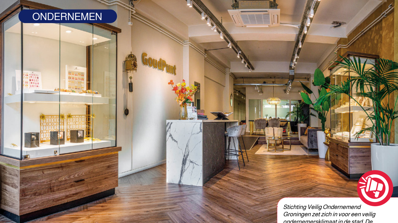
De zaak GoudPunt in de Oosterstaat. De ondernemers wilden uit privacyoverwegingen niet op de foto.