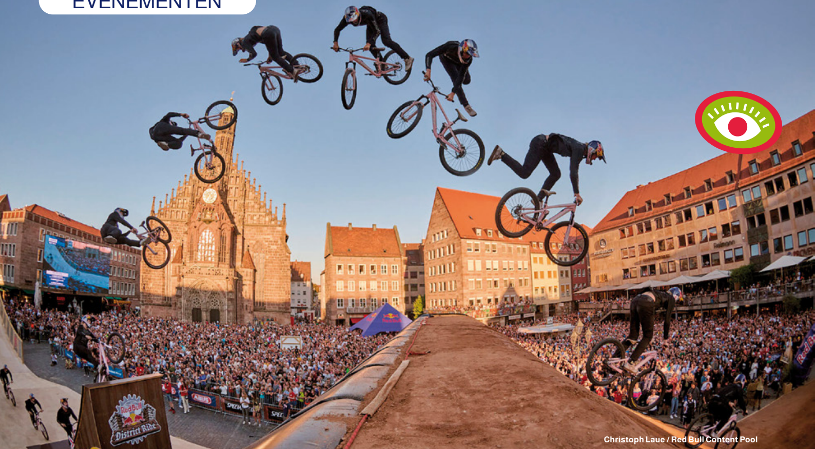
Christoph Laue / Red Bull Content Pool