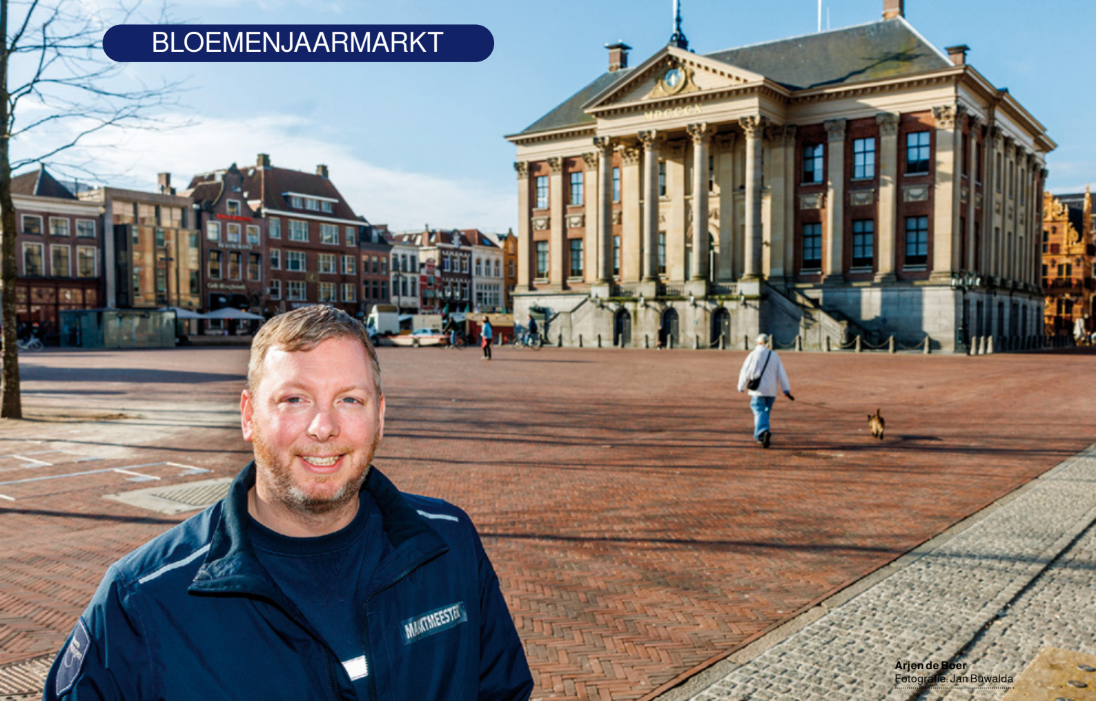
Arjen de Boer